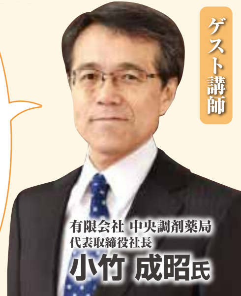
有限会社 中央調剤薬局 代表取締役社長